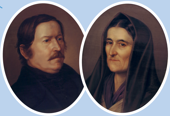
Orlay Petrics Soma festményei Petőfi szüleiről