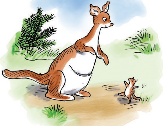
Kanga és Zsebibaba